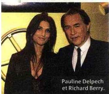
Pauline Delpech et Richard Berry.