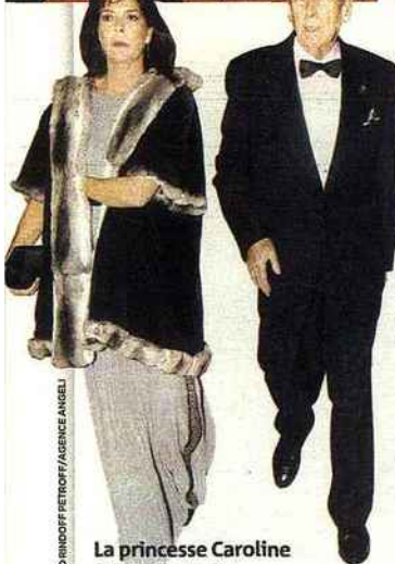
La princesse Caroline de Hanovre et Valéry Giscard d'Estaing.