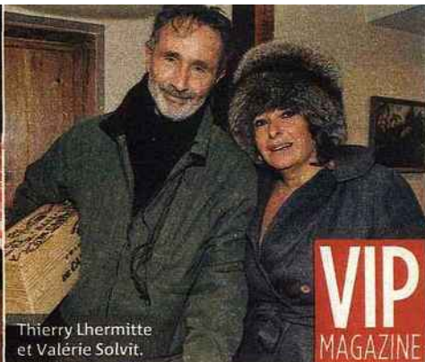
Thierry Lhermitte et Valérie Solvit.