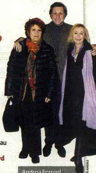
Andrea Ferreol, Patrick De Carolis et Marie-Anne Chazel.