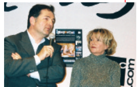
Denis Olivennes et Eve Ruggieri.